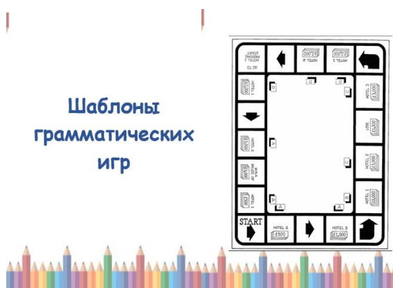
Рисунок 3. Пример шаблона грамматической игры

Каждая игра снабжена подробной инструкцией, но учитель может вносить в нее свои коррективы, ориентируясь на особенности своих групп. В основном задания игр ориентированы на упражнения из учебника и рабочей тетради. Раньше я старалась задания из тетради давать ученикам на дом, но в итоге поняла, что все ответы просто списываются из интернета. Для самостоятельных работ я часто практикую составление подростками собственных заданий для одноклассников. Составляя работу, они сами еще раз повторяют материал, освежают знания, а впоследствии выступают консультантами при взаимопроверке. Для некоторых игр в пособии есть специальные шаблоны для копирования.