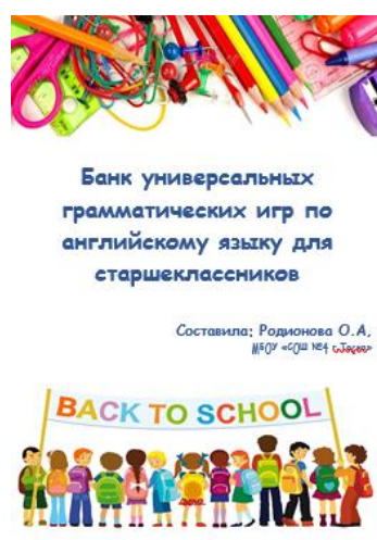
Рисунок 2. Сборник грамматических игр

Участие в ряде вебинаров, семинаров с участием авторов зарубежных пособий, открыло для меня новую тенденцию в преподавании иностранного языка: уход от бесконечного числа дополнительных распечаток и максимальное использование возможностей учебника и рабочей тетради. Оказывается, даже скучные задания по раскрытию скобок и сопоставлению можно превратить в увлекательную игру. Заинтересовавшись этим вопросом, я тщательно изучила иностранные пособия, посетила тематические вебинары в закрытых группах учителей английского языка и решила создать пособие универсальных грамматических игр.